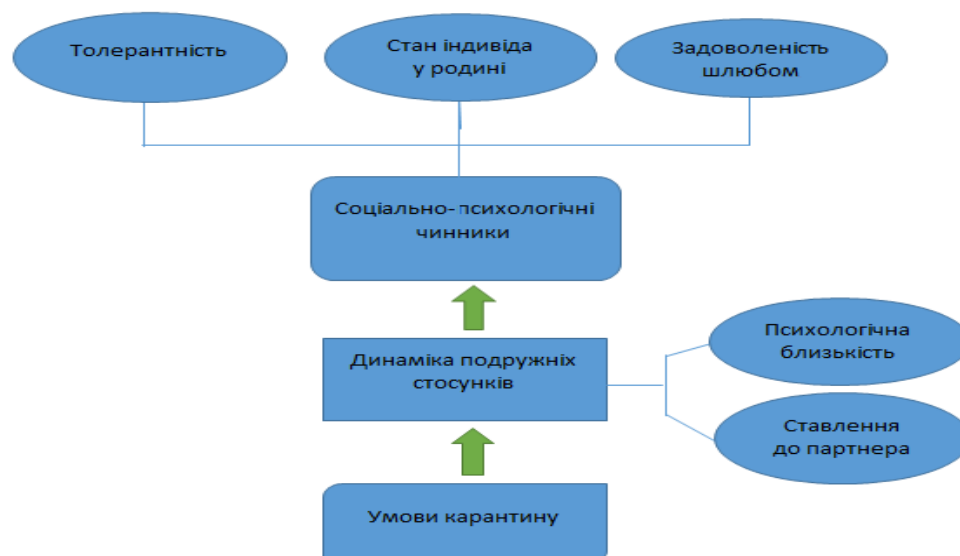
Рис. 1. Концептуальна модель дослідження